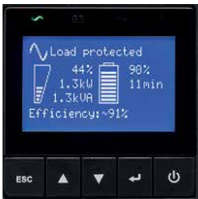
9SX графический ЖК-дисплей