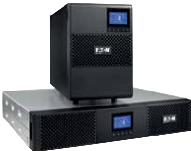
9SX модели стойка и башня